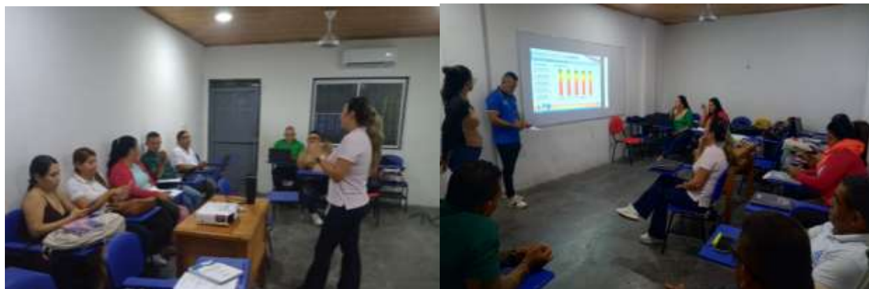
Evidencia fotográfica aula de clase

Asimismo, el aula fue entregada con la dotación correspondiente, la cual quedó registrada en el acta de entrega, donde se relaciona el estado general del aula y los siguientes elementos: