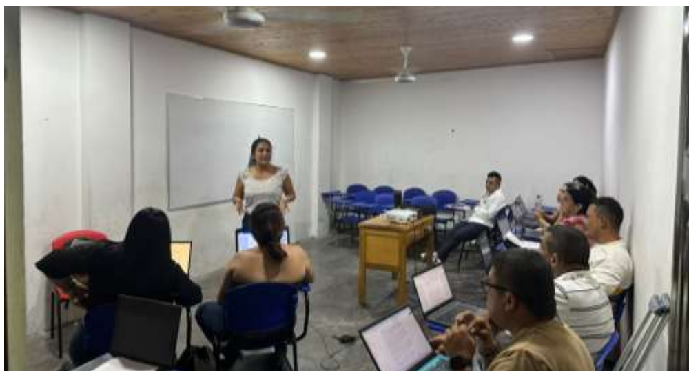
Evidencia fotográfica aula de clase

Dirección: Calle 8 N° 7-59 / Calle 8 N° 8-36 Barrio Centro Espinal